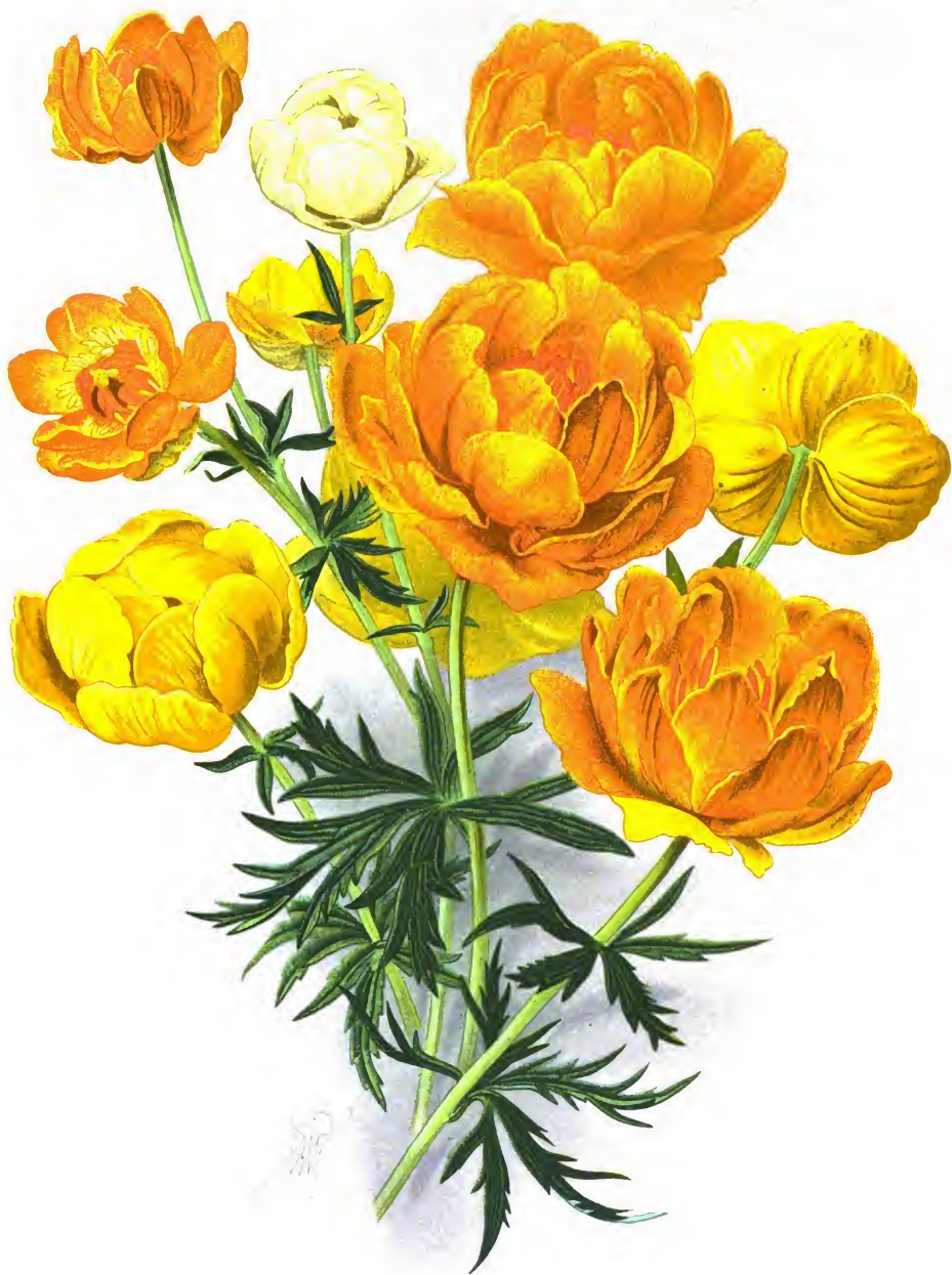
Trollius asiaticus (1.); Trollius asiaticus „Goldball“ (2.); Trollius europaeus (3.); Trollius europaeus sulphureus (4.). Купальница азиатская [1.]; Купальница азиатская "Золотой шар" [2.] Купальница европейская [3.] и ее разновидность с сѣрножелтыми цвѣтами [4.]